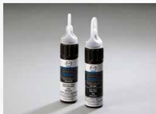
06 // PINTURA DE RETOQUE** / 0000-92-XXX