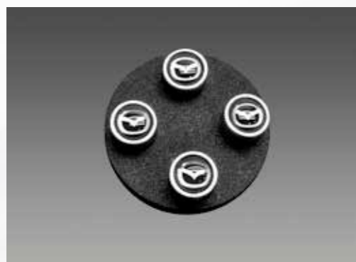
03 // TAPONES DE VÁLVULAS DE AIRE (4)* / 0000-83-Z38