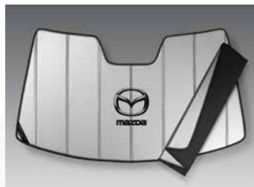
04 // PANTALLA SOLAR PARA PARABRISAS CON LOGO / 0000-8M-R01A