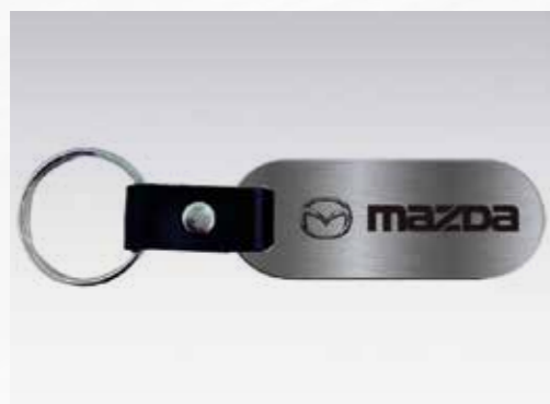
02 // LLAVERO MAZDA / 0000-83-Z41