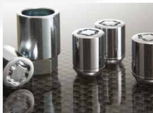
01 // BIRLOS DE SEGURIDAD (4)* / 0000-88-120D-BP 0000-88-BLK_BP (NEGROS)