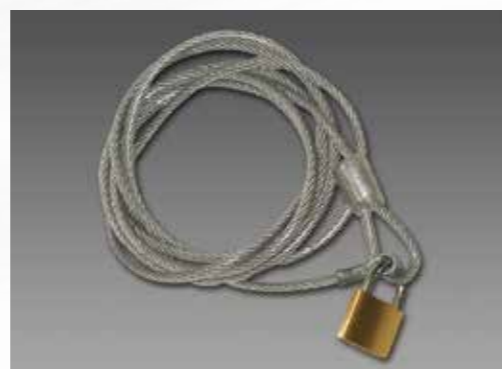
05 // CANDADO PARA FUNDA CUBREAUTO / 0000-88-0900-LK