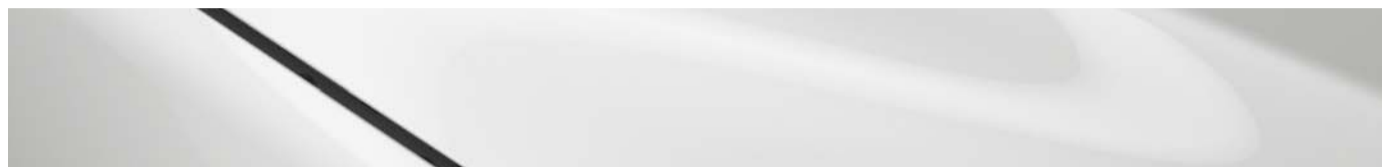
Blanco Aperlado Mica