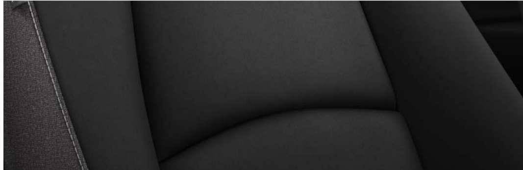
Versiones i e i Sport