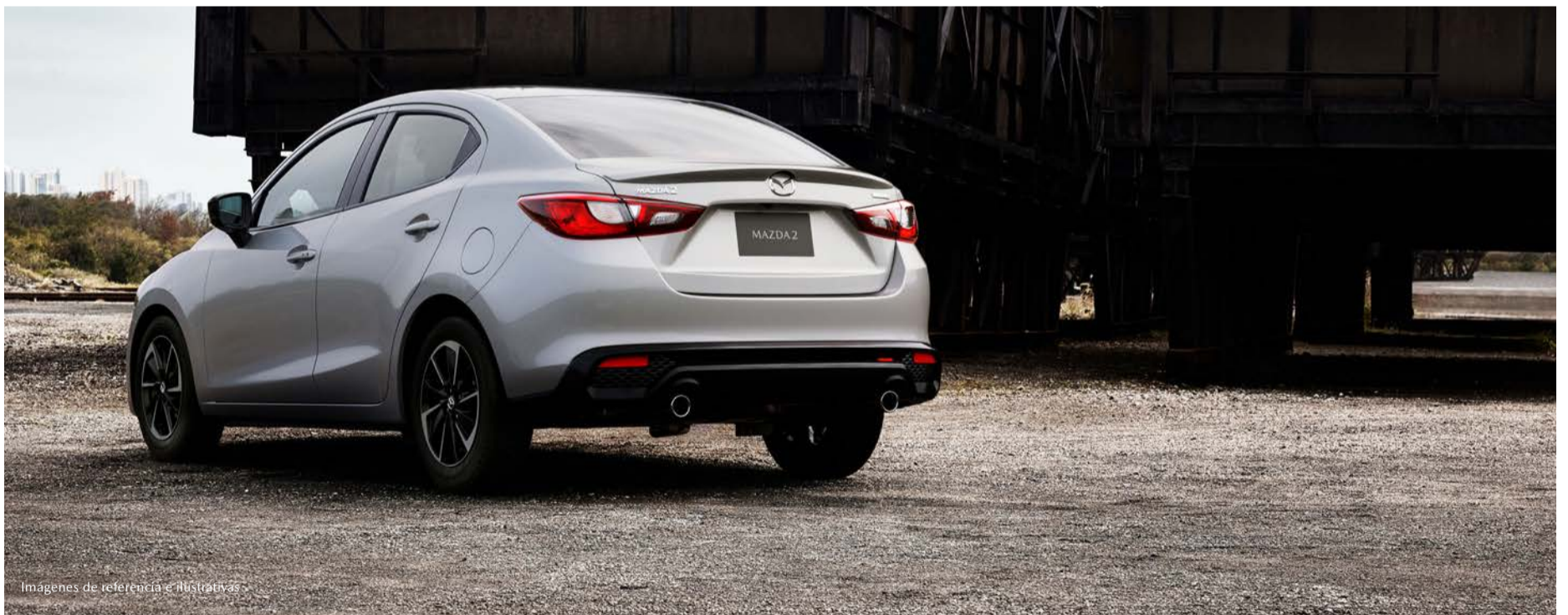
Imágenes de referencia e ilustrativas

*Precios de contado en Moneda Nacional, válidos para la República Mexicana. Sujetos a cambio sin previo aviso. Incluyen IVA e ISAN. Los precios no incluyen accesorios. Las imágenes son de referencia e ilustrativas.