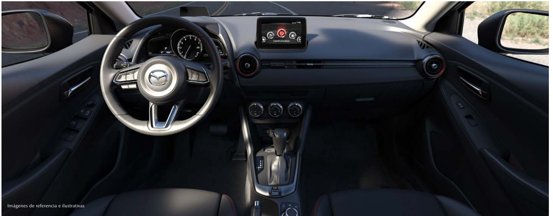
Imágenes de referencia e ilustrativas