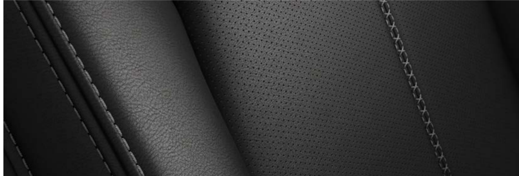
Versión i Grand Touring