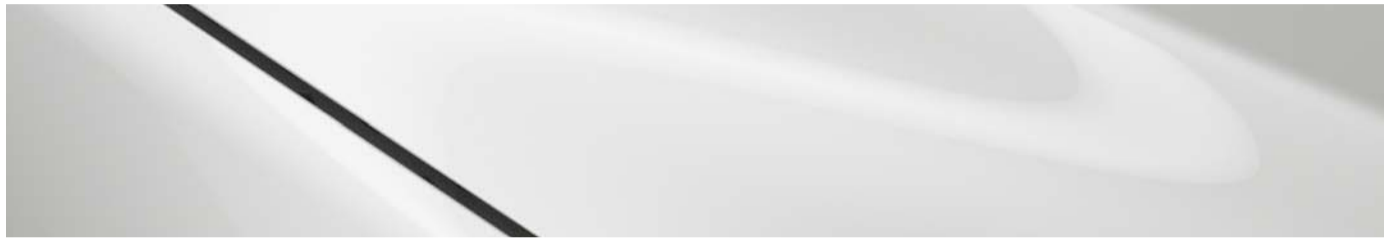
Blanco Aperlado Mica