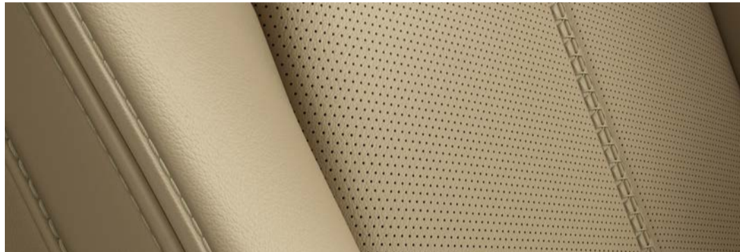
Versión i Grand Touring