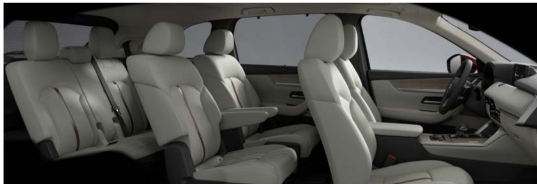
Versión Signature MHEV (Asientos Capitán)