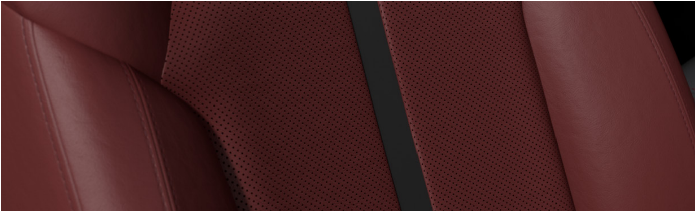
Versión Carbon Edition MHEV