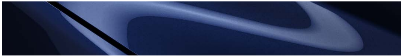
Azul Marino Profundo