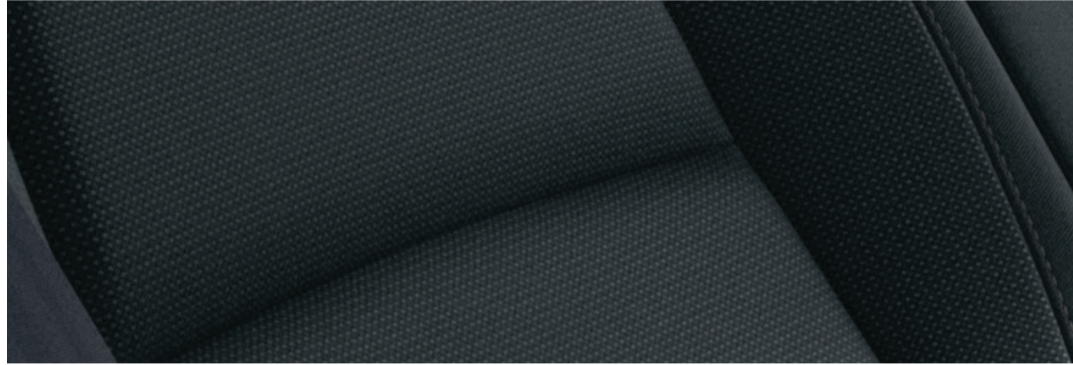
Versión i - i Sport