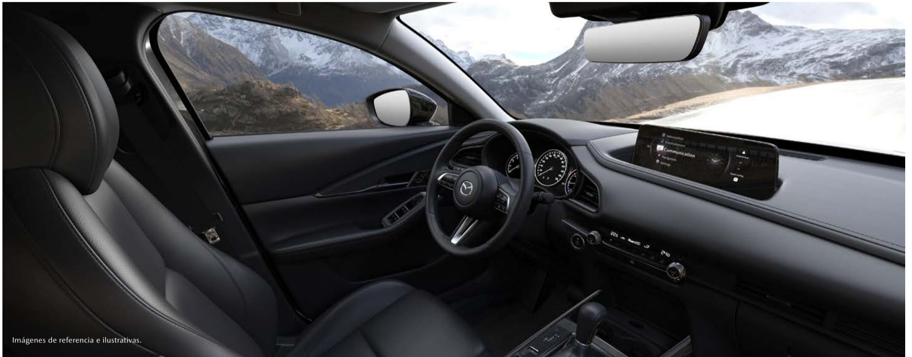
Imágenes de referencia e ilustrativas.