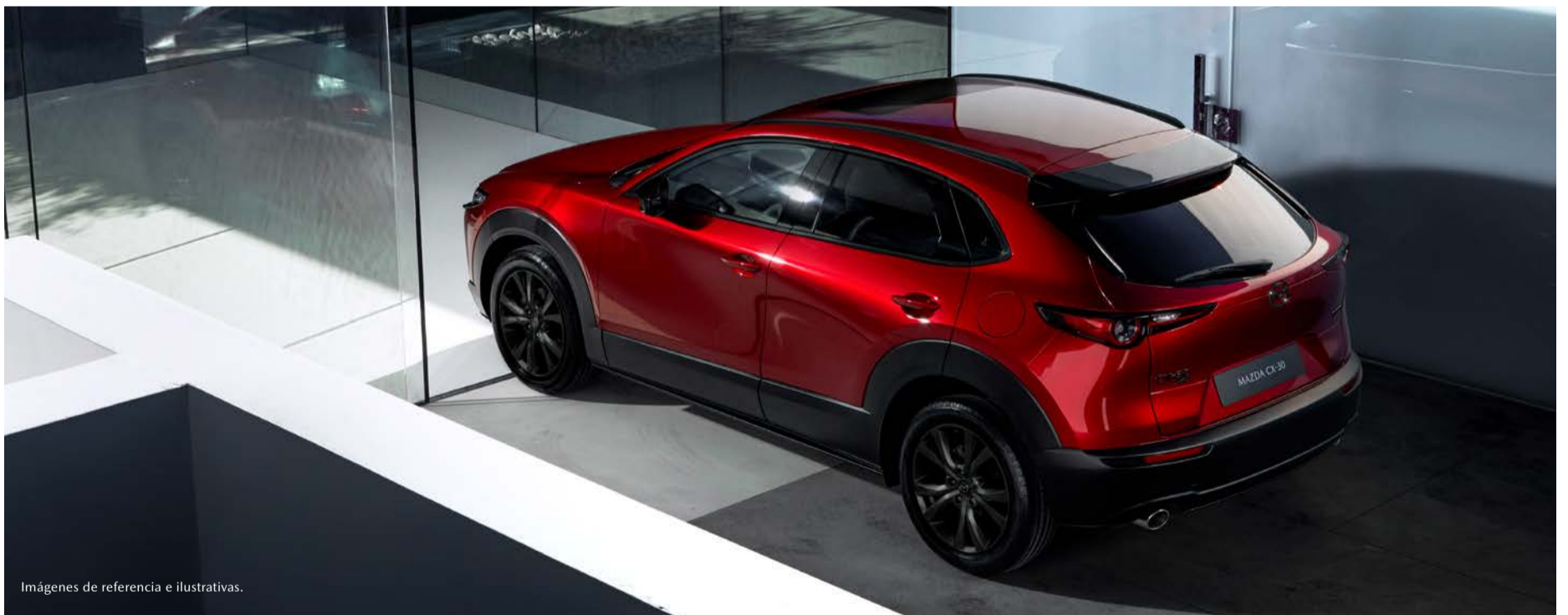
Imágenes de referencia e ilustrativas.

*Precios de contado en Moneda Nacional, válidos para la República Mexicana. Sujetos a cambio sin previo aviso. Incluyen IVA e ISAN. Los precios no incluyen accesorios. Las imágenes son de referencia e ilustrativas.