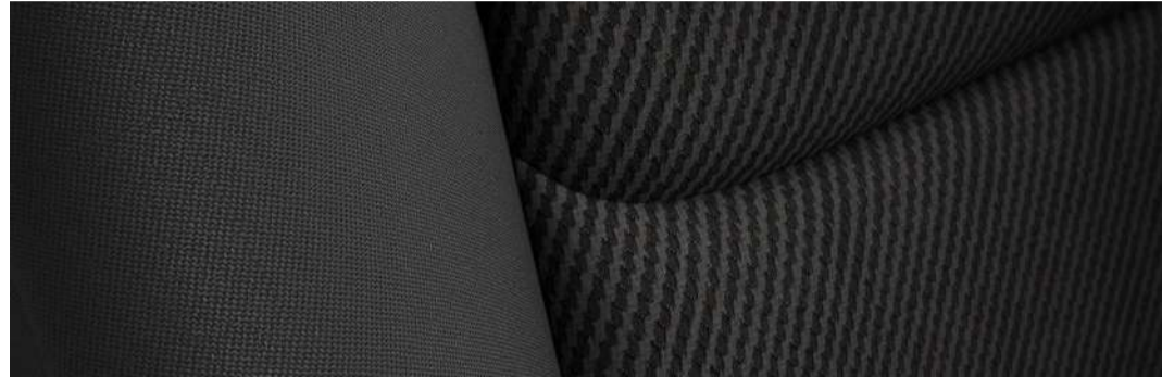
Versión i Sport