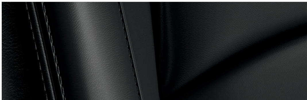
Versión i Grand Touring y Signature